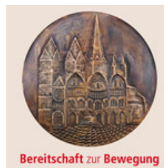
Bereitschaft zur Bewegung